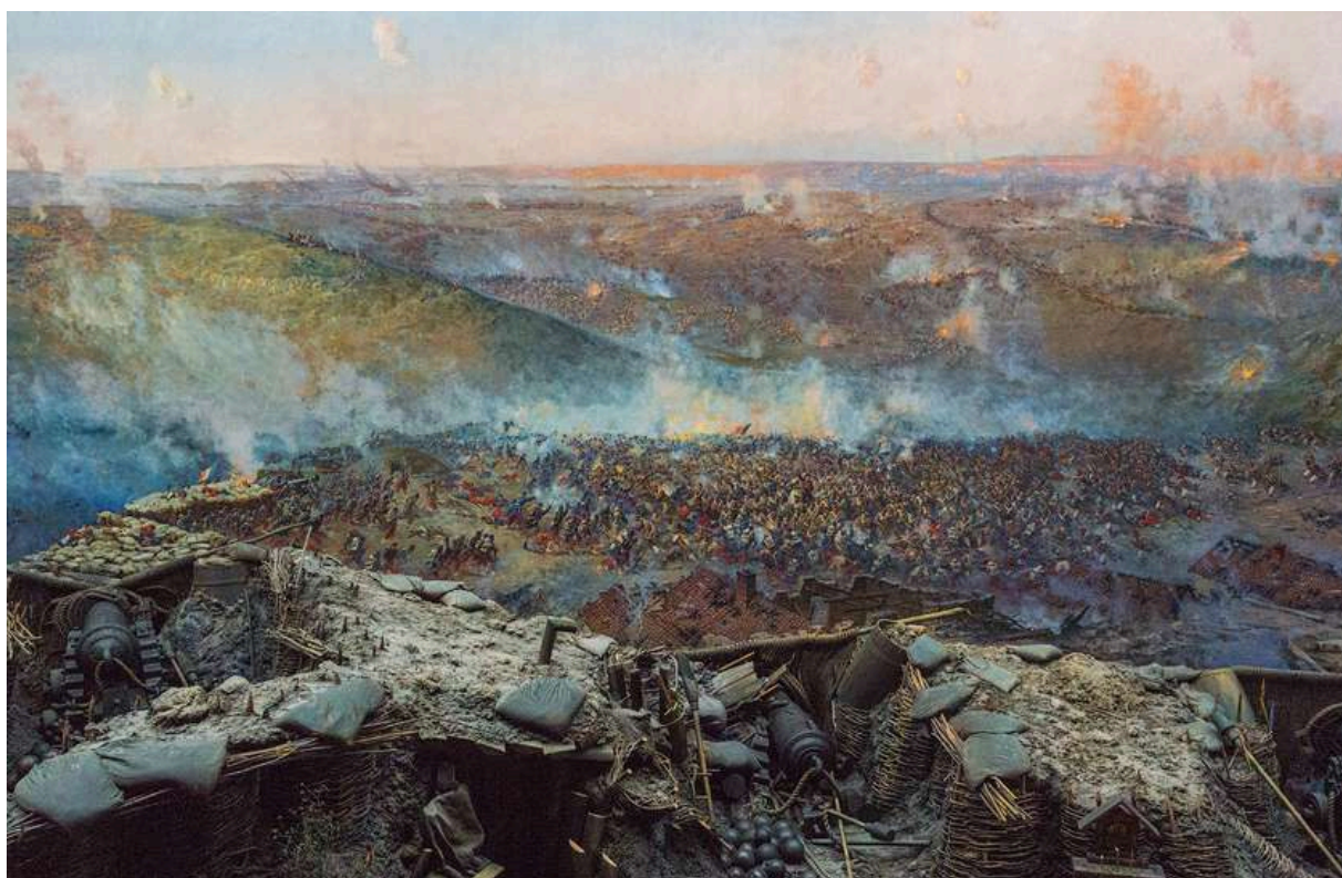
Оборона Севастополя, 1855 г.

Можем сделать вывод о том, что, хоть война оказалась для нас довольно печальной и унижающей, мы многого лишились, однако она и показала необходимость изменений и в свою очередь стала толчком к ним, став бесценным опытом и ещё одной героической страницей в истории нашей страны.