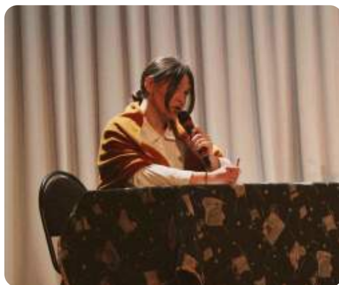
Надия на «Вдохновении»

- Признаться честно, подготовка к выступлению была очень сумбурной, я несколько раз хотела отказаться от чтения. Времени учить текст было мало, а также я не всегда понимала, как будет лучше показать всю суть переживаний героини. Но в конечном итоге, благодаря поддержке и помощи моих близких, я все же решила попробовать себя, о чем я совершенно не пожалела.