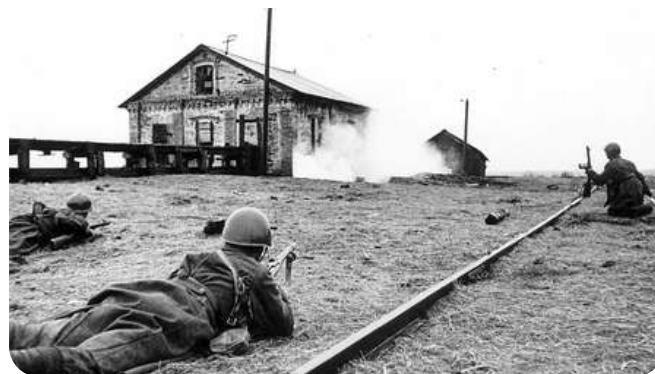
Сентябрь 1942г., битва за станцию Сталинград-1

22 июня 1941 началась Великая отечественная война. Стремительное наступление противника с помощью тактики «железного кулака», заставшее врасплох нашу армию, которая занималась переоснащением и переводением линии Сталина на Запад, первые подвиги советской армии, Брестская крепость, танки у Москвы, минирование метро и эвакуация стратегических пунктов и заводов на Восток. Таким был калейдоскоп событий первого года. Но генерал Мороз, свежие сибирские дивизии, героизм советских солдат – и башкир, и татар, и чеченцев,