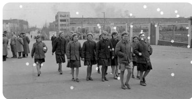
Послевоенное время, 1947г.

23 августа 1942 года немцы прорвались к городу. Когда бои уже были в 1,5 километрах от тракторного завода, его рабочие продолжали работать на победу, и изготавливая танк, сами же садились в него и отправлялись на фронт. И это тоже сыграло немало важную роль. Выехавшие без боеприпасов танки отпугнули войска немцев, дав время для укрепления позиций нашим солдатам. Защищали город все: милиционеры, заводчане, женщины и подростки, старики. И их стремительность застала немцев врасплох, дав надежду не то что всей стране, а всему миру, который задержав дыхание наблюдал за всем. В город продолжали стягивать советские войска. Под обстрелы, под бомбёжку. Людей же старались эвакуировать как можно быстрее, но были те, кто